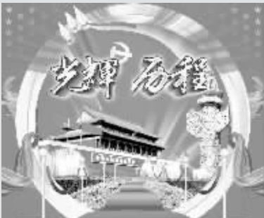
纪念中国共产党成立95周年 1921年—2016年