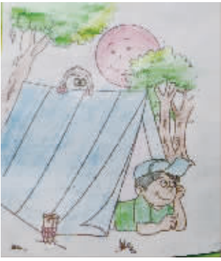
小记者:邵钰雅 编号:161181 学校:周口七一路二小二(1)班