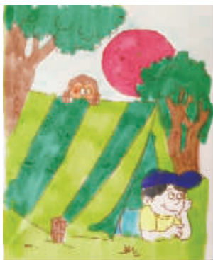
小记者:郭奕琳 编号:160782 学校:周口七一路一小三(4)班