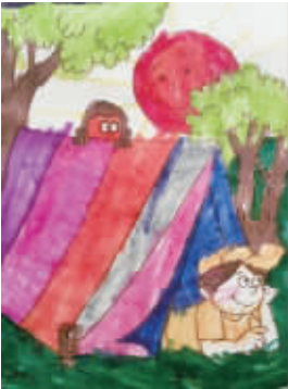
小记者:陈曦 编号:160656 学校:周口五一路小学二(4)班