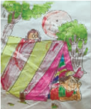
小记者:闫宜宁 编号:160397 学校:周口实验小学三(2)班