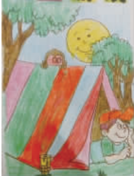
小记者:刘馨泽 编号:165293 学校:西华西关小学四(3)班