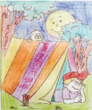
小记者:陈雅雯 编号:162062 学校:周口六一路小学三(3)班