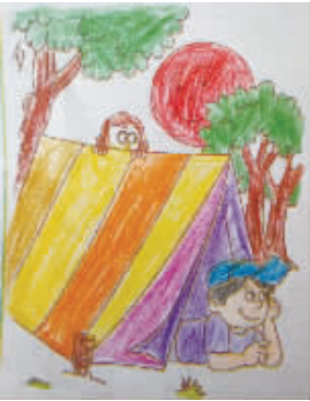
小记者:省灵惠 编号:160919 学校:周口七一路一小四(4)班