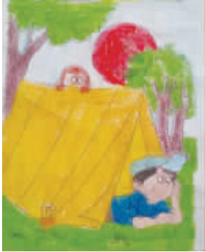
小记者:赵雅琨 编号:160388 学校:周口实验小学三(2)班