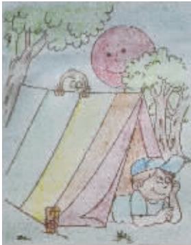
小记者:张茗 编号:161139 学校:周口闫庄小学五(2)班