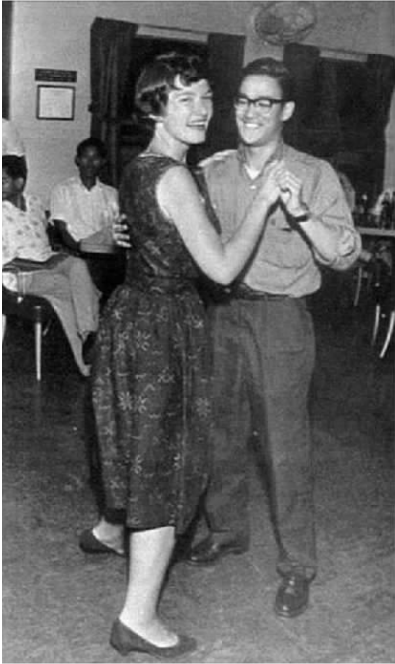
李小龙正与一位羞涩的女士翩翩起舞

古往今来，人才一直是先进生产力和先进文化的创造者、传播者和推动者。纵观历朝历代的统治者，知人善任者国家兴盛，反之则易造成社会动荡，加剧王朝更迭，人才的进退关系到国家的安危。国以人兴，政以才治！