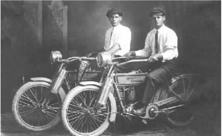
威廉·哈雷和阿瑟·戴维森