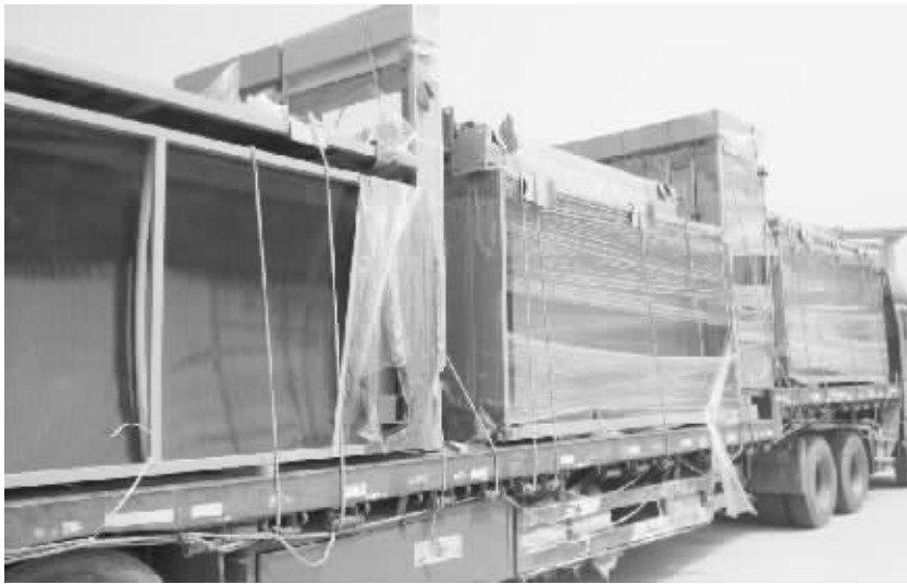
首批抵周的公交站亭