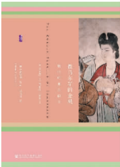
《撒马尔罕的金桃——唐代舶来品研究》 薛爱华著 社会科学文献出版社出版

如今的撒马尔罕,是中国“一带一路”沿线国家乌兹别克斯坦的第二大城市,连接着伊朗、印度和中国,依然是中亚地理的文明心脏。我们今天阅读《撒马尔罕的金桃》,追慕已经逝去的唐代文明,也充满希冀地展望未来的欧亚大陆,能够重现当年商贾云集、驼铃不断的文明交融之盛况。