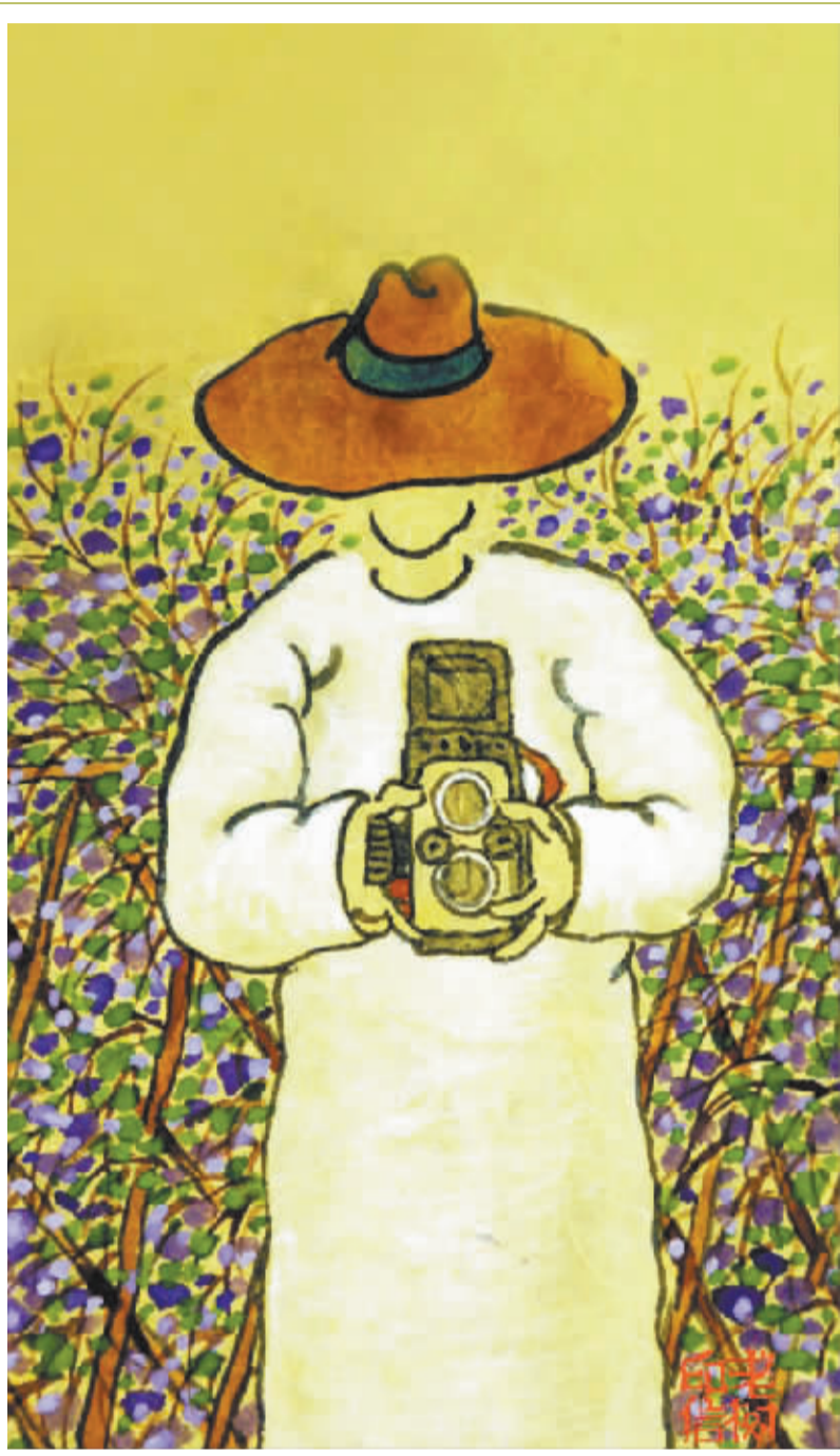
我看着这世界，我看着你。照片里的一切，却是我自己。