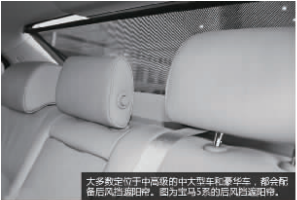
大多数定位于中高级的中大型车和豪华车,都会配备后风挡遮阳帘。图为宝马5系的后风挡遮阳帘。

通常被配备在一些定位于中高级的中型和中大型轿车上,当然,对于豪华车来说,这应该算是个标准配置。这项配置主要的功能是为后排乘客遮挡强烈的日照与紫外线,同时也能在一定程度上增加私密性,由于它采用了打孔式的遮阳帘材质,并不会影响到驾驶者观察车辆后方情况。遮阳帘的开启与关闭按键大多数被设置在前排的中控台或车窗升降按键附近,而对于一些高端的中大型车和豪华车来说,后排乘客也可以进行控制。