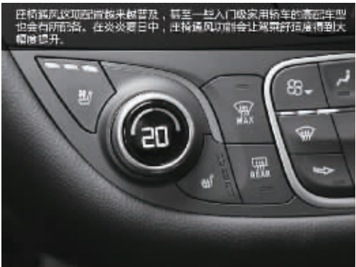
座椅通风这项配置越来越普及,甚至一些入门级家用轿车的高配车型也会有所配备。在炎炎夏日中,座椅通风功能能让驾乘舒适度得到大幅度提升。