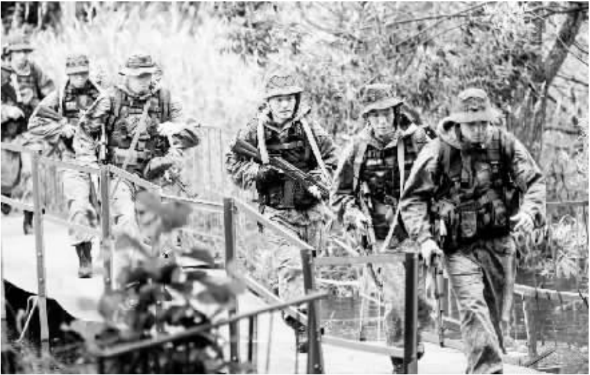
7 月 6 日,在俄罗斯莫斯科,中俄参训队员进行训练。 当日,中国武警部队与俄罗斯国民近卫军“合作-2016”联合反恐训练在莫斯科近郊的捷尔任斯基独立作战师驻地进行。此次联合训练主要围绕反恐行动具体技战术问题展开,目的是巩固和发展中俄全面战略协作伙伴关系,加强两军友好务实合作,探索联合反恐作战、训练方法和手段,提高联合反恐训练水平和反恐作战能力。