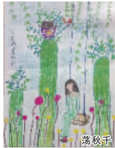
小记者:李若彤 编号:161586 学校:周口文昌小学二(4)班