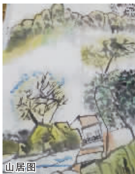
小记者:赵雅琨 编号:160388 学校:周口实验小学三(2)班