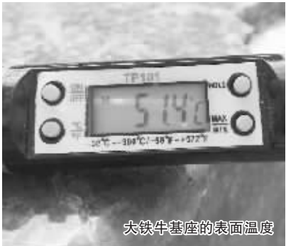
大铁牛基座的表面温度