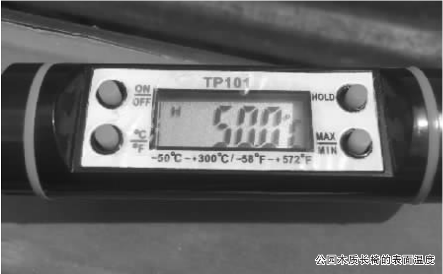
公园木质长椅的表面温度