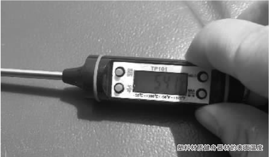
塑料材质健身器材的表面温度

一些交通工具也在饱受高温考验。经测量,一辆停在路边的黑色轿车表面温度高达 60℃,附近一辆摩托车坐垫的表面温度也达到了 56.4℃。市民在使用这些交通工具时,一定要注意避免烫伤。