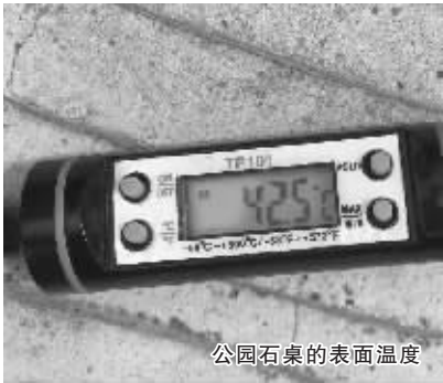
公园石桌的表面温度