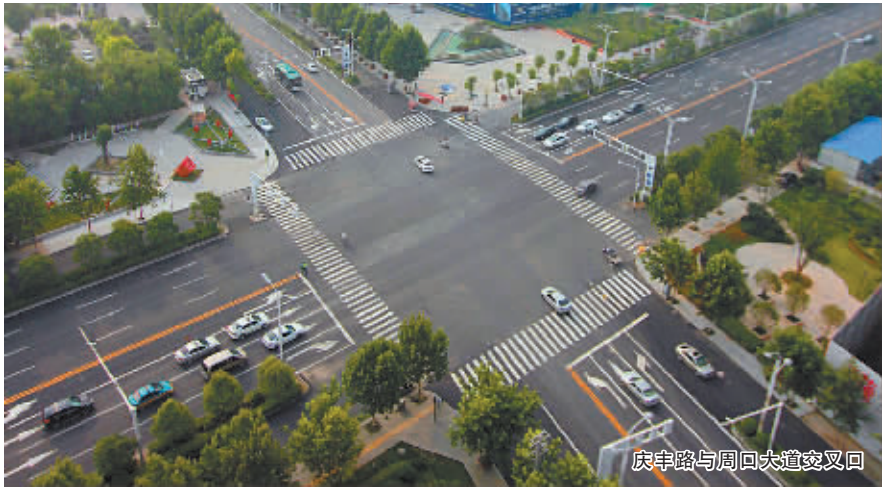
庆丰路与周口大道交叉口

8月2日上午，周口晚报记者实地查看发现，周口中心城区主干道改造工程基本完工，其中，周口大道（建设大道至沙颍河周口大道桥段）、庆丰路（大庆路至人和路段）、建设大道（龙源路至大庆路段）和七一路（大庆路至周口大道段）已经完工，八一大道南延工程部分完工，周项快速通道建设工程及太清路续建工程正在施工。此次道路改造工程的顺利进行，将为我市创建省级文明城市夯实基础。