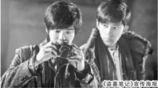
《盗墓笔记》宣传海报