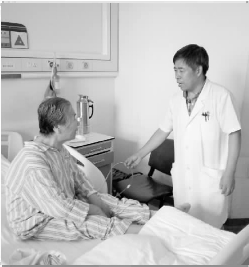
徐智询问患者病情