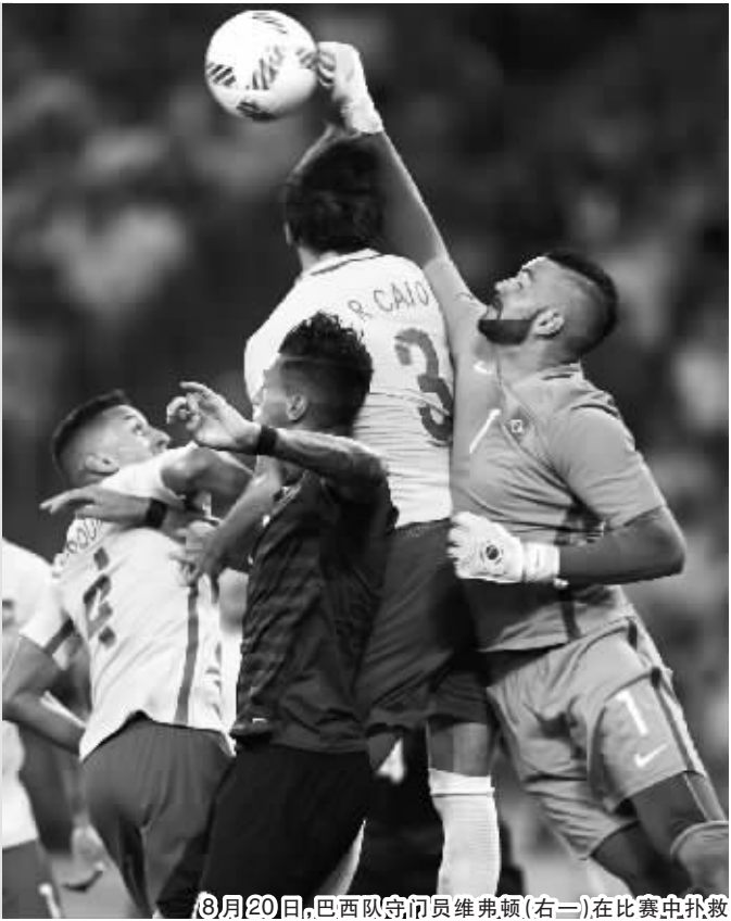
8月20日,巴西队守门员维弗顿(右二)在比赛中扑救

新华社里约热内卢 8 月 20 日电 （记者 姚友明 赵焱）凭借当家球星内马尔定海神针般的发挥,东道主巴西队在 20 日进行的里约奥运会男足决赛中通过点球大战以 6:5(点球 5:4)战胜劲敌德国队,拿到巴西历史上首枚男子足球奥运金牌。 巴西队队长内马尔成为了“桑巴军团”夺冠的最大功臣,他在上半场通过一记质量极高的任意球为巴西队首开纪录,并在点球大战最关键一轮中锁定胜局。 作为巴西足球标志性建筑之一,马拉卡纳球场当日座无虚席,作为一个视足球为生命的国度,巴西全国上下对于这枚金牌有着热切的期盼。不过,在比赛开始之后,德国队率先占据了场面上的主动。比赛进行到第 11 分钟,尤·布兰茨的一脚大力远射命中巴西队球门横梁,险些完成破门。第 26 分钟,巴西队在罚球区左侧获得任意球机会,内马尔右脚施射,球钻入球门左上角,巴西队取得 1:0 领先。 比赛进行至第 59 分钟,德国队利用巴西队后防线上的混乱觉得机会,经过一连串传切配合后从右路撕开对手防线,由马·迈尔在点球点附近扫射得手,双方以 1:1 回到同一起跑线。比赛剩余时间双方互有攻守,但均未能再度破门,进入最后点球大战。 双方前四轮点球全部命中,德国队第五个出场的尼·彼得森的射门被巴西队门将扑出,而巴西队第五个出场的内马尔则顺利将球送入球门,巴西队最终惊险夺冠。值得一提的是,日前刚刚在奥运会上拿到第九枚金牌的牙买加“闪电”博尔特也加入到欢庆的人群中,与“东道主”球迷共同庆祝胜利。 巴西队成为自 1992 年巴塞罗那奥运会之后,首支在主场成功夺得男足冠军的队伍。内马尔攻入了职业生涯在奥运会上的第七个进球,仅次于攻入 8 球的传奇球星贝托,排在巴西队史第二位。 “这是我生命中经历过最美妙的事情之一。此前那些批评我们的人应该收回他们的话了!”内马尔赛后说。 同日早些时候结束的奥运男足铜牌争夺战中,尼日利亚队 3:2 力克洪都拉斯队。继 1996 年的冠军和 2008 年的亚军后,“非洲雄鹰”现在已经集齐奥运男足三种颜色的奖牌!