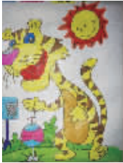
小记者:张一涵 编号:169021 学校:周口实验小学三(4)班