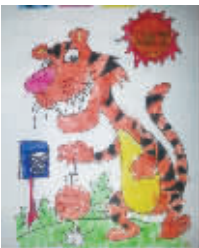
小记者:孟想 编号:160275 学校:周口实验小学二(2)班