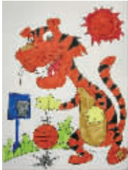
小记者:王烁 编号:161275 学校:周口七一路二小三(2)班