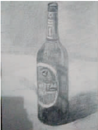
酒瓶 小记者:王文文 编号:169059 学校:周口一中七(2)班

本栏目刊发小记者的书法、绘画、摄影等作品。小记者们如果有这些爱好,快快拿起手中的笔开始创作吧! 作品创作完成后,请用相机拍下来发送到 zkwbxjz@126.com