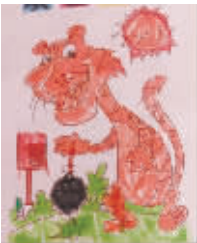
小记者:胡智勇 编号:161647 学校:周口文昌小学四(5)班