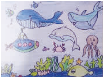
丰富多彩的领域 小记者:付雅鑫 编号:160540 学校:周口实验小学五(1)班