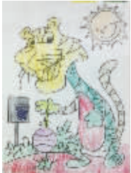
小记者:卢明 编号:169065 学校:周口建设路小学一年级