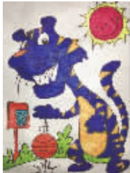
小记者:张开娴 编号:160780 学校:周口七一路一小三(4)班