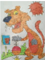
小记者:吉星睿 编号:60668 学校:周口五一路小学三(2)班