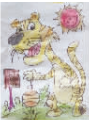
小记者:郑懿轩 编号:160779 学校:周口七一路一小三(4)班