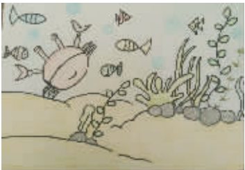
海底世界 小记者:赵晨彤 编号:160413 学校:周口实验小学三(3)班