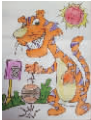
小记者:郭锦瑶 编号:160698 学校:周口五一路小学四(3)班