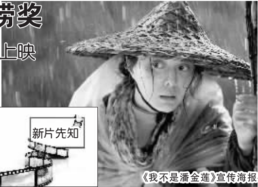
《我不是潘金莲》宣传海报

此次公开放映中，不少观众对具有东方韵味的圆形画幅和电影画面感到震撼，有观众兴奋评价“画面非常精