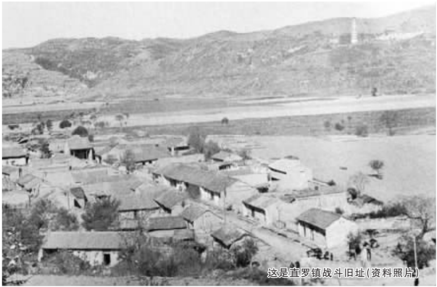
这是直罗镇战斗旧址(资料照片)