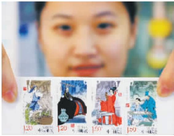
10月7日,山东省邹城市邮政局工作人员展示《中华孝道(二)》特种邮票。

当日,中国邮政发行《中华孝道(二)》特种邮票1套4枚,图案内容分别为“百里负米”“亲尝汤药”“文姬续书”和“恺之画母”,全套邮票面值5.40元。