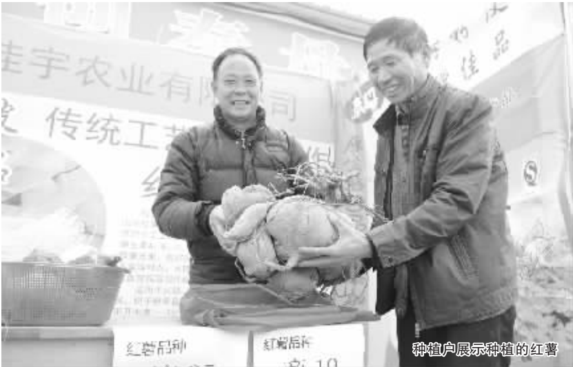
种植户展示种植的红薯