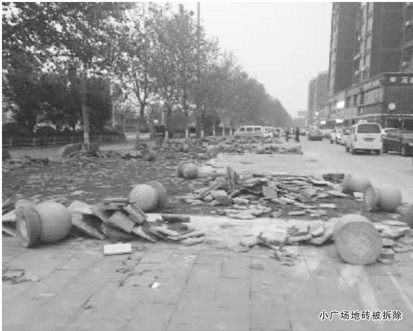
小广场地砖被拆除