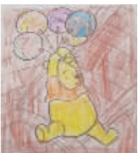
小记者:省灵惠 编号:160919 学校:周口七一路一小五(5)班