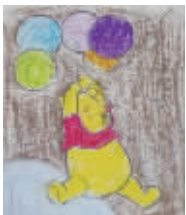
小记者:李涵笑 编号:166139 学校:商水县直二小五(4)班