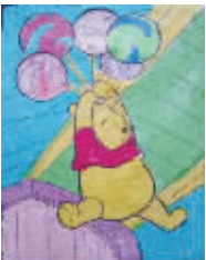
小记者:朱芷锐 编号:160446 学校:周口实验小学四(3)班