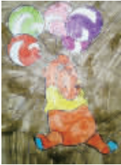
小记者:陈雅雯 编号:162062 学校:周口六一路小学四(3)班