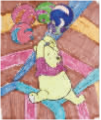
小记者:张开娴 编号:160780 学校:周口七一路一小四(4)班