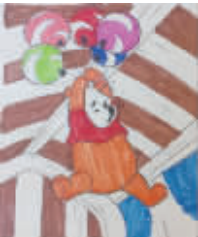
小记者:王媛爱 编号:162568 学校:周口实验小学五(3)班