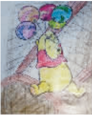
小记者:曹鑫洋 编号:161259 学校:周口七一路二小三(5)班