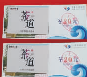
中悦上尊礼包一份