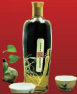
吉林三炮人参酒一瓶