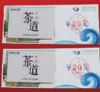
中悦上尊礼包一份