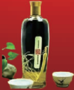
吉林三炮人参酒一瓶