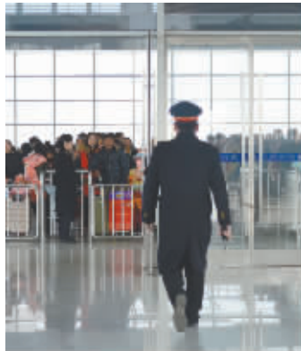
开往襄阳的列车 11 时 36 分刚刚开走,又要投入到新的忙碌之中——12 时 10 分有一班开往广州的列车。