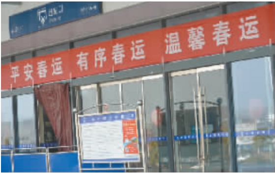
平安、有序、温馨,不仅仅是条幅上一个一个的字,更是一个一个车站人的辛苦。