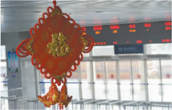
浓浓的年味,是周口火车站工作人员的祝福。