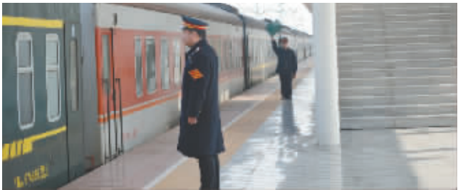
他们的大年初三,就在站台上,火车边。