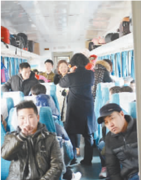
列车上的旅客。对许多人而言,短暂的相聚之后,就是又一次长长的别离。