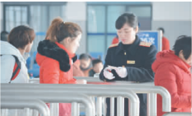
她能够记得清吗?一天之中,该有多少张车票从她手中剪过?