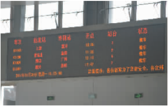
不停闪烁着的车次,提醒着旅客离开周口的时间。