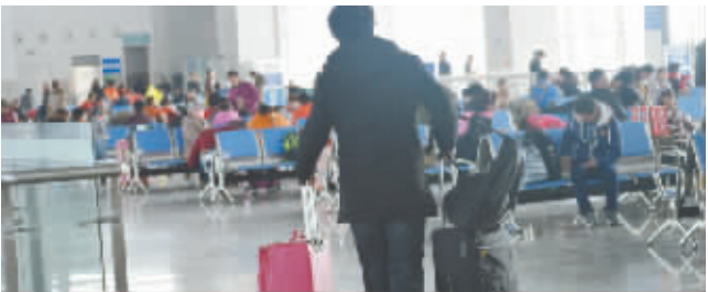
温暖的候车大厅里,盛满了沉甸甸的行囊。