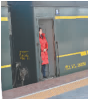
大年初三,她和许多同事都在客车上,火车再一次缓缓开动,她再一次渐行渐远……