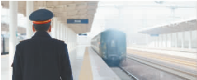
目送着火车渐行渐远,他轻轻舒了口气。