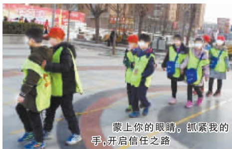
蒙上你的眼睛，抓紧我的手，开启信任之路