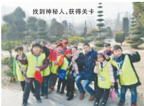
找到神秘人，获得关卡

1 月 19 日，“奔跑吧，少年！”小记者挑战赛欢乐举行，60 余名小记者不停奔跑、释放活力、穿越城市、接受挑战，在团队合作中，通过一个个游戏提升成就感和责任感，磨练自己，快乐成长。