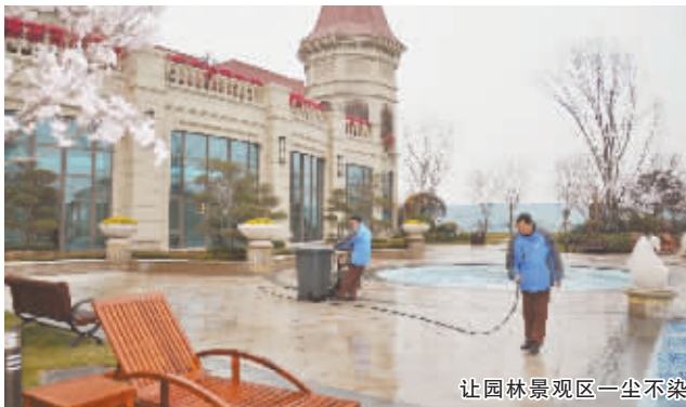
让园林景观区一尘不染