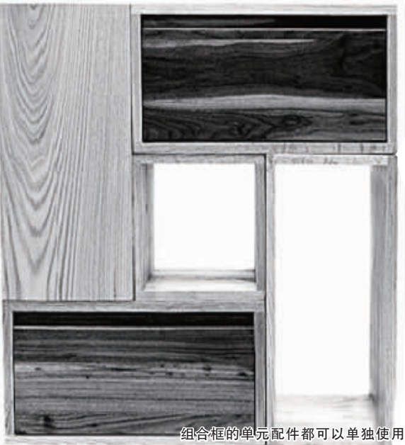
组合柜的单元配件都可以单独使用

定制家具的设计中也不乏温暖人心的设计,某品牌的海纳百穿系列就是一个典范。该系列产品不遵从传统衣柜的刻板设计,更多考虑人性化的使用功能。在产品 and 配件的开发上更具多元化。例如带来储物功能的柜门,可以收纳各种小配件;侧拉的长抽屉柜,同样可以收纳小配件,为衣柜提供多样化的储物功能。