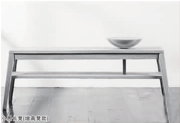
小愚长凳(增高凳款)