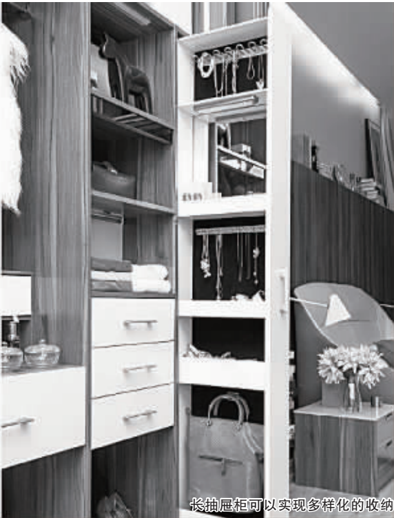
长抽屉柜可以实现多样化的收纳

设计师为这款长凳设计了许多配件。其中有一款配件是衣帽架,衣帽架可以嵌入长凳上,变成一款更加实用的玄关凳。设计师贴心地在衣帽架的下方设计一个圆盘,方便放置钥匙、小饰品等。另一个配件是一个增高凳,安装在长凳上可以增加凳子的高度。作为餐椅使用时,增高凳变成一张儿童桌。设计师还天马行空地 为长凳设计了木马造型配件,安装上配件,就能变成一只大型的木马,颇有童趣。