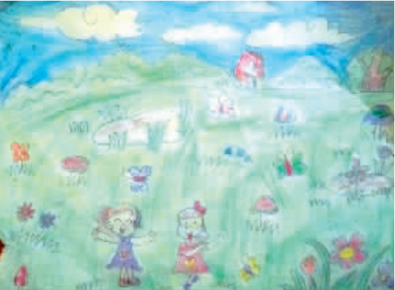
小记者:陈颖 编号:175336 学校:西华县明德小学四(5)班