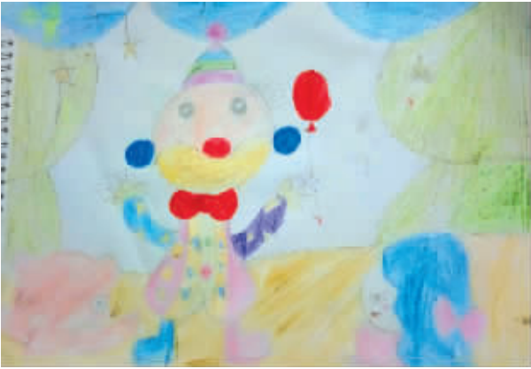
小记者:王宇燕 编号:175307 学校:西华县西关小学四(1)班