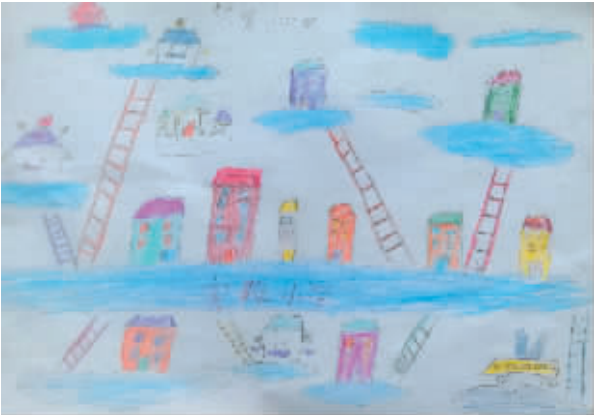
小记者:李晨曦 编号:175033 学校:西华县实验小学二(4)班