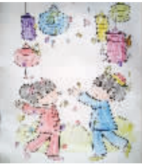
小记者:左枫梧 编号:171572 学校:周口七一路一小二(1)班