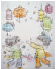
小记者:徐小童 编号:17554 学校:周口纺织路小学二(1)班