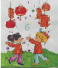
小记者:徐珂雯 编号:172219 学校:周口六一路小学一(1)班