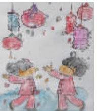
小记者:王龙翔 编号:170008 学校:周口纺织路小学四(5)班

小记者,你是否常常想画一幅漂亮的画,可是却苦于无从下笔?本期开始,小记者填色游戏火热来袭,小伙伴们快来填涂属于自己的“秘密花园”吧。作品涂好后,可用相机或者手机将其拍下来发至zkwbxjz@126.com,写清姓名、编号、学校班级,请注意图片格式和清晰度,本报将选取较好的作品在下期《小记者报》和小记者微信平台集中展示。