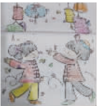
小记者:省恩惠 编号:171721 学校:周口七一路一小五(5)班