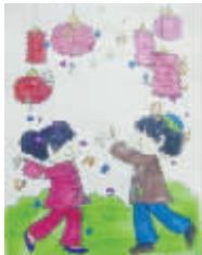
小记者:何梦欣 编号:172548 学校:周口纺织路小学三(6)班