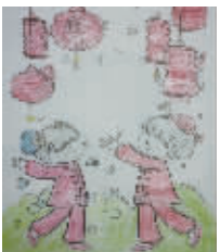
小记者:蒋露 编号:171053 学校:周口实验小学三(4)班