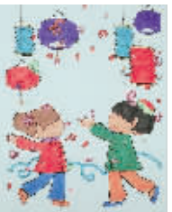
小记者:王烁 编号:170649 学校:周口七一路二小四(2)班