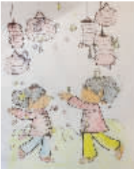
小记者:王晨旭 编号:172253 学校:周口六一路小学二(1)班