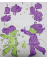
小记者:胡智勇 编号:172441 校:周口文昌小学五(5)班