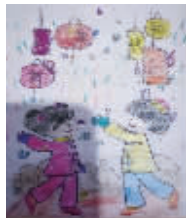
小记者:孙浩翔 编号:171492 学校:周口五一路小学三(1)班