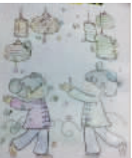
小记者:魏新雨 编号:170922 学校:周口实验小学二(1)班