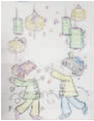
小记者:张瑶瑶 编号:171365 学校:周口建设路小学一(1)班