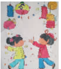
小记者:马超然 编号:172288 学校:周口六一路小学二(3)班