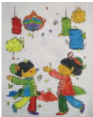
小记者:衡阳 编号:171387 学校:周口建设路小学三(2)班