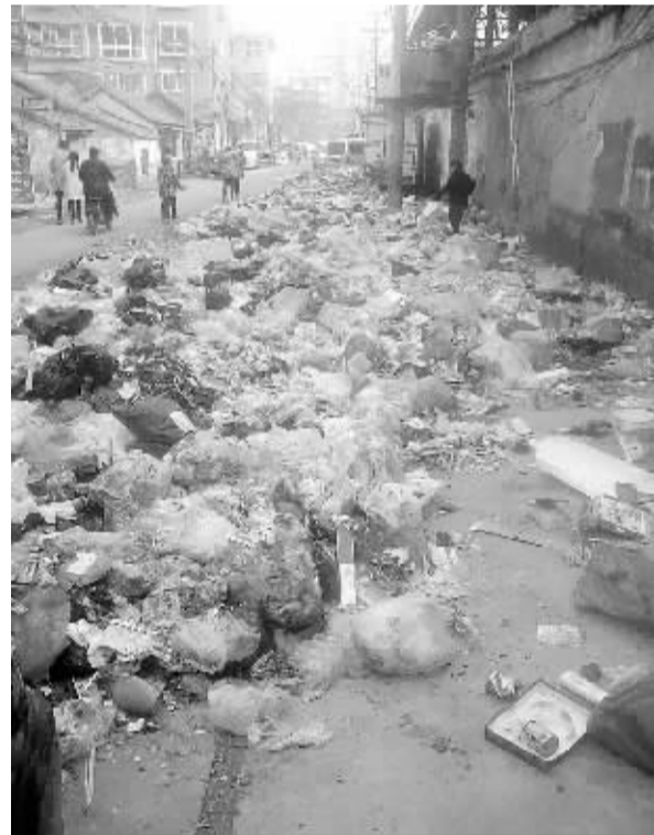
项城市任营路祥和家园小区门在路上，长期堆放着很多生活垃圾。