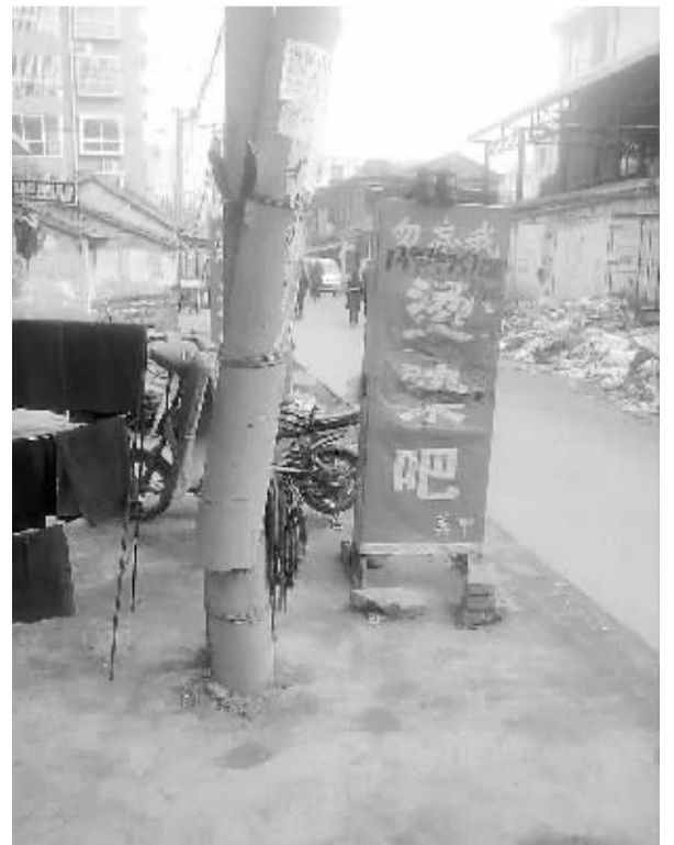
在项城市任营路祥和家园小区门口附近，一根线杆折断，被人用铁丝捆绑。