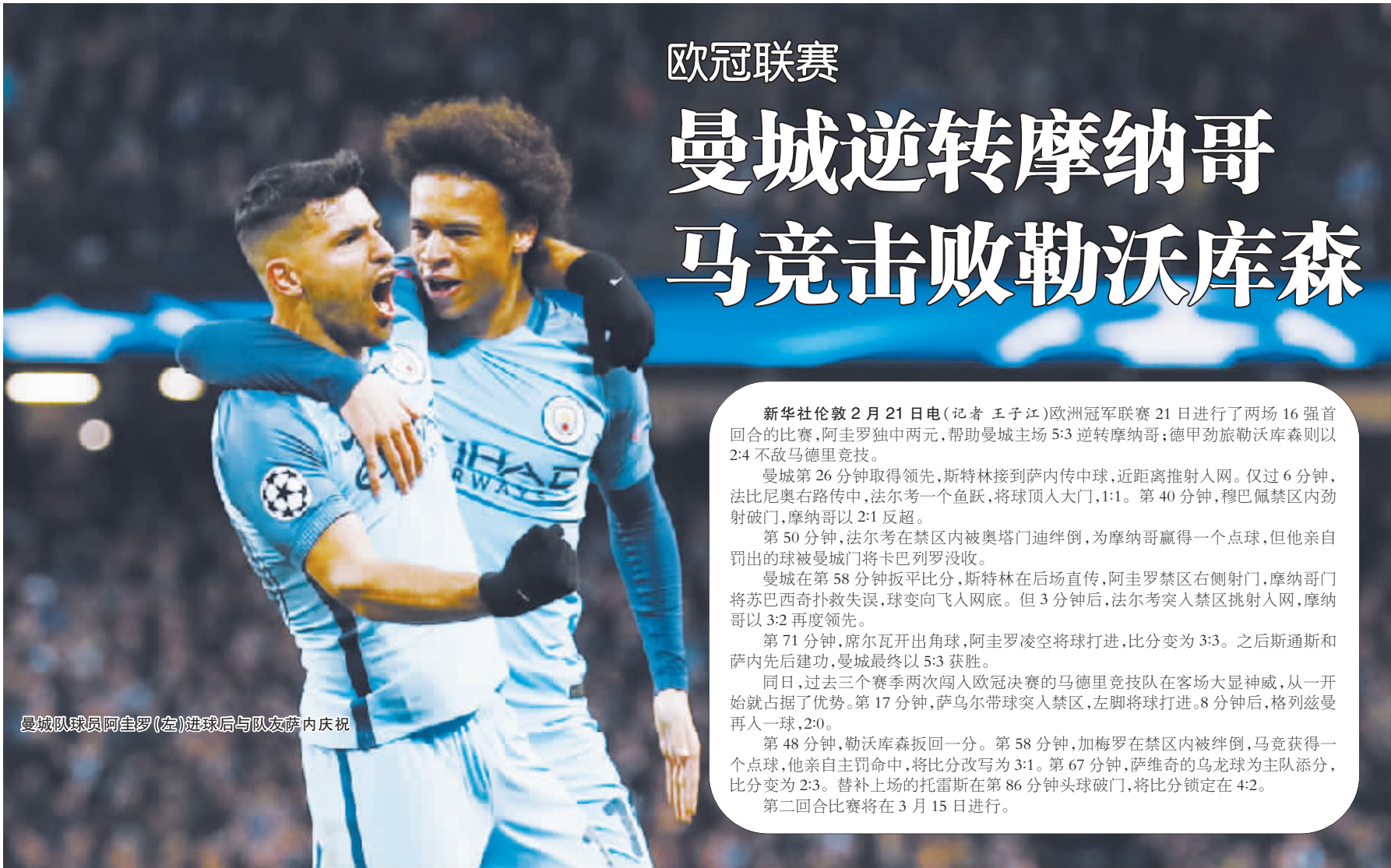
曼城队球员阿圭罗(左)进球后与队友萨内庆祝