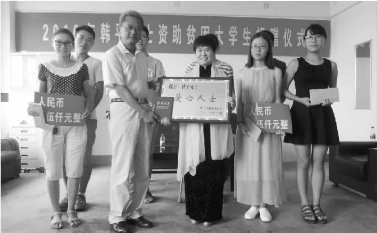
韩平资助贫困大学生现场