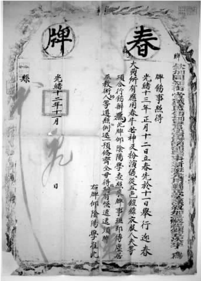
光緒十二年四川南部縣衙關於舉行迎春大典的春牌

在清代四川南部縣衙檔案中，有許多關於舉辦迎春大典的文字記載。每當春季來臨之際，官府均要正式行文，明確舉行迎春大典儀式的相关事宜。以下兩件涉及迎春大典的檔案，分別是該縣光緒十二年(1886年)的春牌和光緒十四年(1888年)的簽。