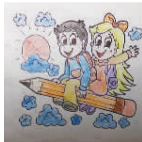
小记者：省恩光 编号：171658 学校：周口七一路一小四(1)班