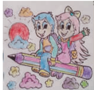
小记者：贾若雨 编号：170150 学校：周口莲花路小学二(3)班