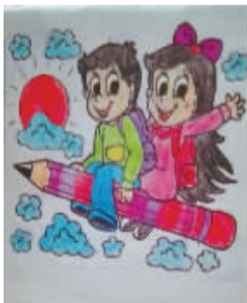
小记者：王依诺 编号：171947 学校：周口六一路小学二(7)班