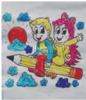
小记者：黄熙森 编号：170326 学校：周口七一路二小一(5)班