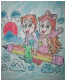
小记者：陈可心 编号：170287 学校：周口七一路二小一(3)班