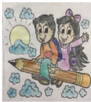
小记者：张若溪 编号：177348 学校：项城市文化路小学三(6)班