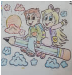
小记者：程子昂 编号：176249 学校：商水县新城小学四(1)班