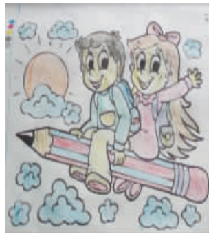
小记者：朱立言 编号：176015 学校：商水县直一小五(2)班