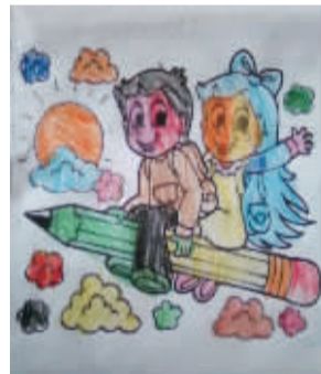
小记者：李佳芮 编号：170403 学校：周口七一路二小一(4)班