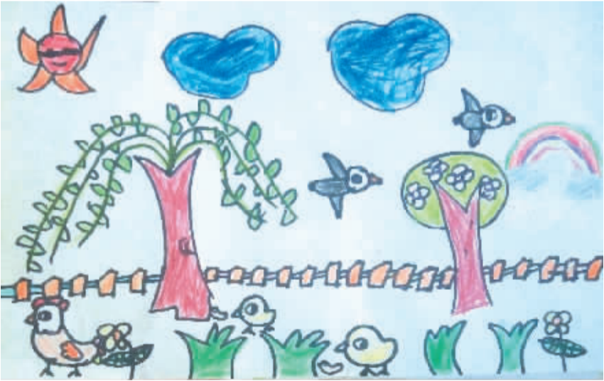
小记者:谭懿浩 编号:175060 学校:西华县实验小学二(4)班

叽喳喳地叫着,仿佛在说:“春天的景色真美!春天的景色真美!” 在这艳丽的春天,万物复苏,春回大地,人们渐渐脱去了厚厚的大衣,换上轻便舒适的春装,突然田野里出现两只家养的小狗,它们互相戏耍着。 一年之计在于春,一日之计在于晨。从今天起,我要认真学习各种文化知识,争取在秋天有一个好的收获。 (辅导老师:李素平)