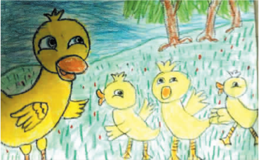
小记者:毕鹏程 编号:175195 学校:西华县昆山学校一(2)班