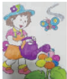
小记者:赵王涵 编号:170972 学校:周口实验小学二(4)班