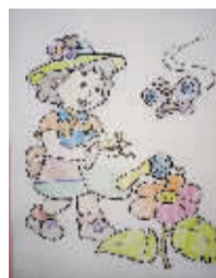
小记者:杨悦 编号:171780 学校:周口六一路小学一(5)班