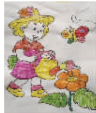
小记者:黄熙森 编号:170326 学校:周口七一路二小一(5)班