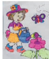
小记者:陈明辉 编号:171726 学校:周口六一路小学一(3)班