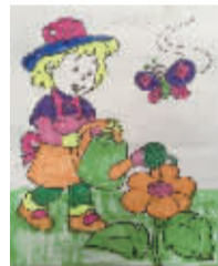
小记者:靳博凯 编号:170903 学校:周口实验小学一(1)班