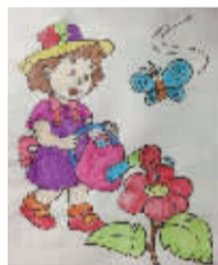
小记者:姚力杨 编号:170861 学校:周口实验小学一(1)班