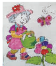
小记者:许家诺 编号:171858 学校:周口六一路小学二(2)班