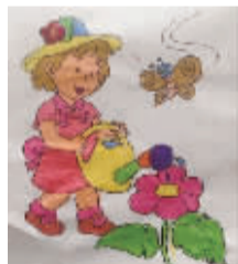
小记者:陈冠宇 编号:170056 学校:周口建设路小学二(1)班