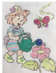
小记者:尚君卓 编号:170902 学校:周口实验小学一(1)班