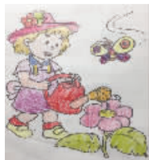
小记者:丁梓涵 编号:171953 学校:周口六一路小学二(7)班