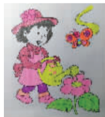
小记者:邵艺璇 编号:170055 学校:周口闫庄小学二(2)班