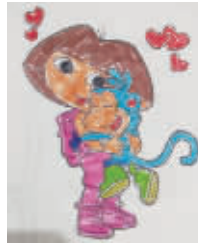
小记者:李明雨 编号:170889 学校:周口实验小学一(1)班