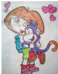
小记者:石若熙 编号:170741 学校:周口七一路二小五(6)班