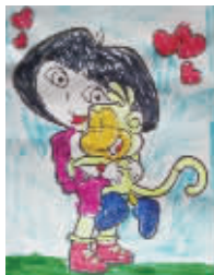
小记者:庞烁烁 编号:170257 学校:周口七一路二小一(2)班