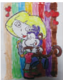
小记者:贾梓萌 编号:171869 学校:周口六一路小学二(2)班