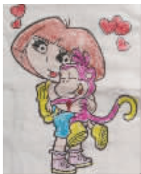
小记者:化雪 编号:170789 学校:周口实验小学一(5)班