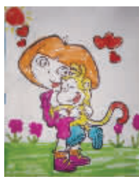
小记者:黄熙森 编号:170326 学校:周口七一路二小一(5)班