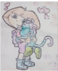
小记者:王雨辰 编号:171862 学校:周口六一路小学二(2)班