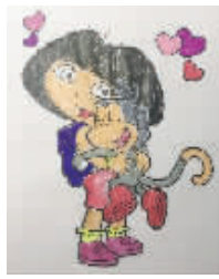
小记者:李武航 编号:171393 学校:周口闫庄小学一(3)班