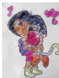
小记者:王邵毅 编号:171557 学校:周口八一路二小一(1)班