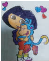
小记者:杨洋 编号:171866 学校:周口六一路小学二(2)班