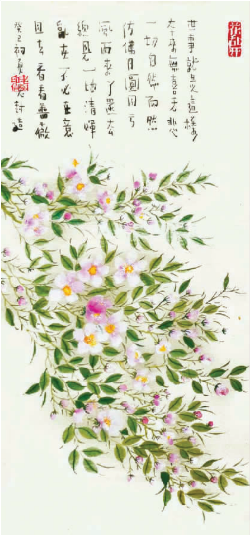
世事就是这样，本来无喜无悲。一切自然而然，仿佛月圆月亏。风雨来了还去，总见一地清晖。乱世不必在意，且去看看蔷薇。

4.昨天问一个大老板，“现在生意都不景气，大家压力都很大，你睡眠怎么样？”他回答：像婴儿般的睡眠。我说：不愧是高手。这样还能睡着！他沉默半晌道：哎，半夜经常醒来，哭一会儿再睡……睡一会儿再哭……5.休完产假回来，同事们纷纷说我胖了好多，心里难过。一次和新同事聊天，不知情的她说：“快生了吧，挺着大肚子，上班一定很累吧！”6.有一天，妈妈问 3 岁的儿子：“‘问’这个字念什么啊？”儿子回答：“念‘门’。”妈妈提示道：“仔细再看看，‘门’里面还有个口字呢。”儿子恍然大悟道：“知道了，念‘门口’。”