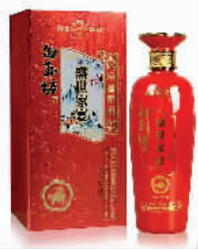
杏花村汾酒集团 42 度盛世家宴喜庆版