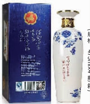
杏花村汾酒集团 53 度盛世家宴