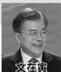
文在寅 共同民主党 候选人