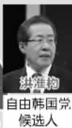
洪准杓 自由韩国党 候选人