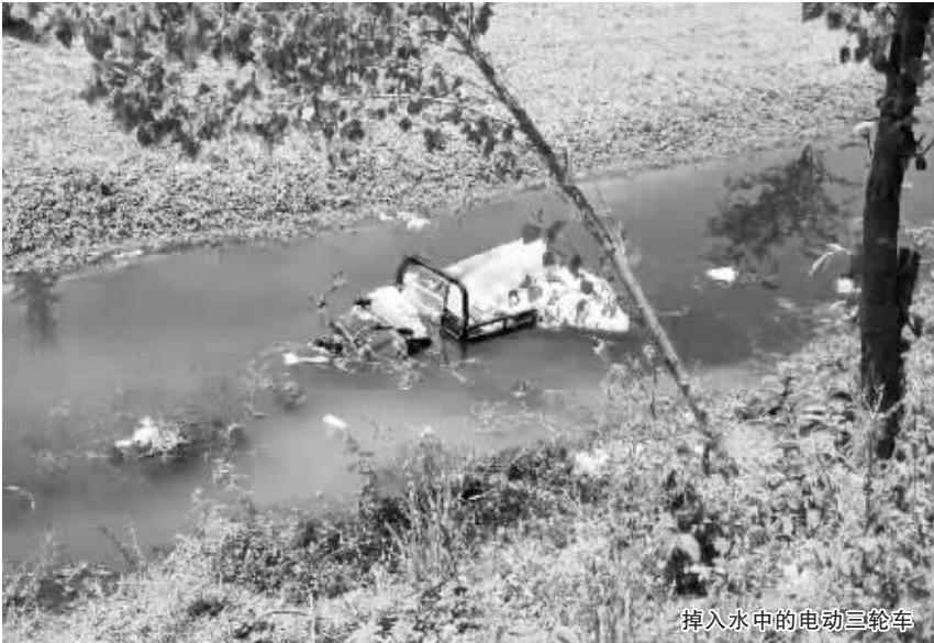
掉入水中的电动三轮车