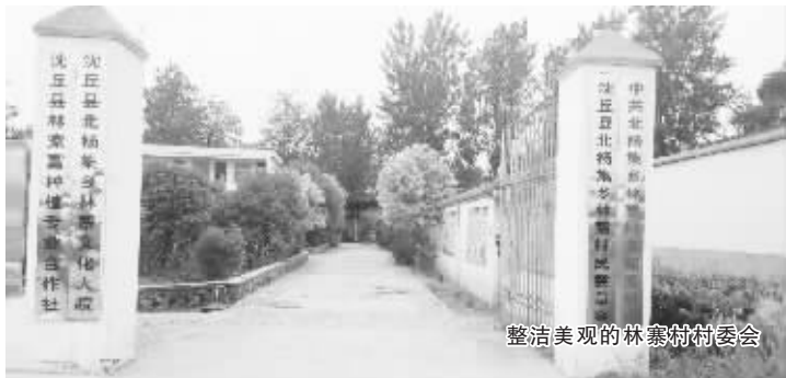
整洁美观的林寨村村委会