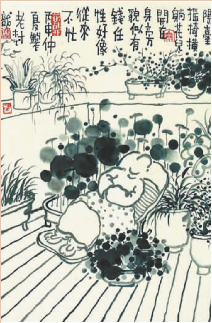
阳台摇椅一躺，花儿开在身旁。 貌似有钱任性，好像从来不忙。 老树画画