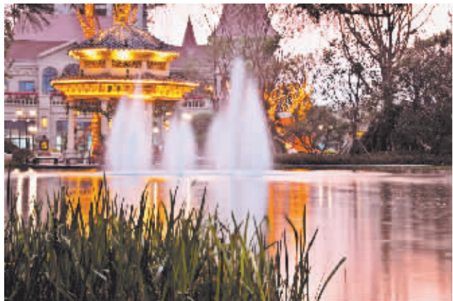
三等奖 作者:李海鹏