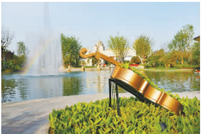
二等奖 作者:何延成