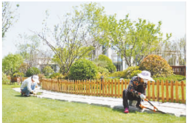
二等奖 作者:李国阁