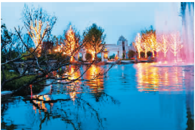
二等奖 作者:何延成