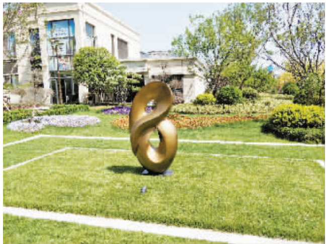
三等奖 作者:李珍珠