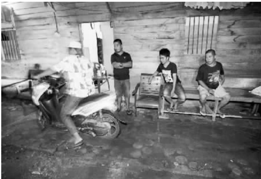
5月29日晚,在印度尼西亚中苏拉威西省,人们在地震后来到户外避险。

印度尼西亚中苏拉威西省29日晚发生6.6级地震,目前尚无人员伤亡和财产损失的报告。