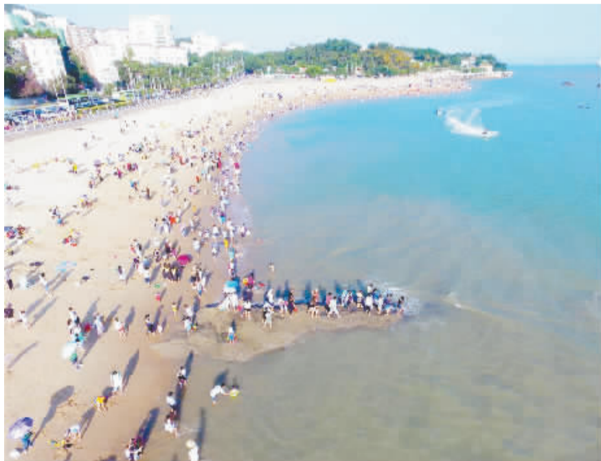
5月29日,游客在厦门环岛路白城沙滩旅游休闲。端午节小长假期间,厦门环岛路沿途景点游人如织,游客踩沙逐浪,享受悠闲假期。