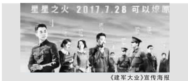
《建军大业》宣传海报

本报综合消息 作为中影“建国三部曲”的第三部作品，电影《建军大业》以雄厚的制作规格、强大的创作班底和华丽的主演阵容，合力呈现中国人民解放军创建之初那段风云变幻的革命岁月，为2017年我军建军90周年庄重献礼。6月13日，片方曝光电影《建军大业》全阵容海报，实力戏骨与青年演员饰演的54个角色齐齐亮相，尽显影片大气磅礴、鸿篇巨制的独特风范。