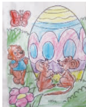
小记者:省恩光 编号:171658 学校:周口七一路一小四(1)班