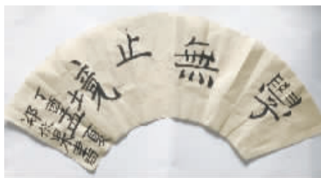
小记者:郑依果 编号:171417 学校:周口闫庄小学二(1)班