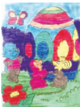
小记者:王奥辰 编号:171508 学校:周口闫庄小学三(5)班