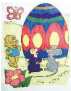
小记者:王烁 编号:170649 学校:周口七一路二小四(2)班