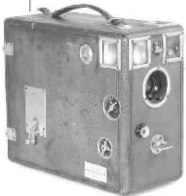
■ Girard Le Radieux 盒式相机,产于1901年