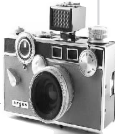
■ Argus C3 Matchmatic, 1936-1966年间曾大规模生产