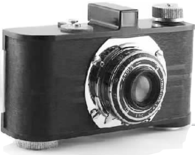
■ Argus, 产于1936-1941年期间