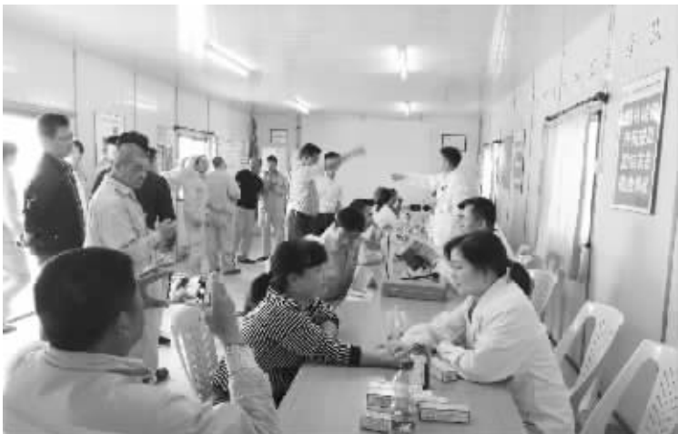
第十九批医疗队的工作人员在为病人诊治