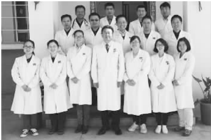
第十九批医疗队工作人员合影