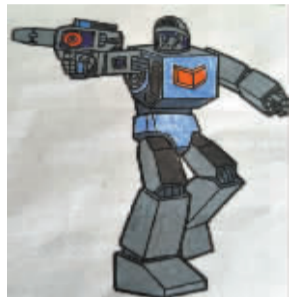
小记者:陈冠宇 编号:170056 学校:周口建设路小学三(1)班