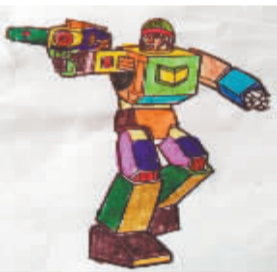
小记者:尚俊宇 编号:171467 学校:周口闫庄小学二(4)班