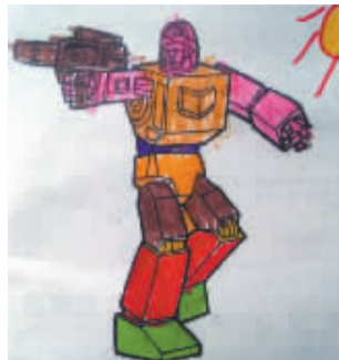
小记者:郑溢薪 编号:172313 学校:周口六一路小学三(3)班