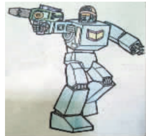
小记者:李之源 编号:170598 学校:周口七一路二小四(4)班