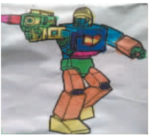
小记者:王奥辰 编号:171508 学校:周口闫庄小学三(5)班