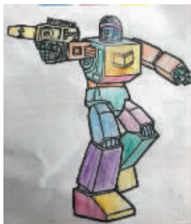
小记者:董津昀 编号:170900 学校:周口实验小学二(1)班