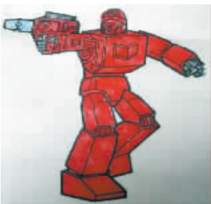
小记者:许家诺 编号:171858 学校:周口六一路小学三(3)班