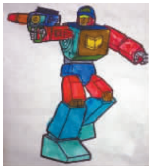
小记者:杨曾睿 编号:171233 学校:周口作坊小学四(4)班